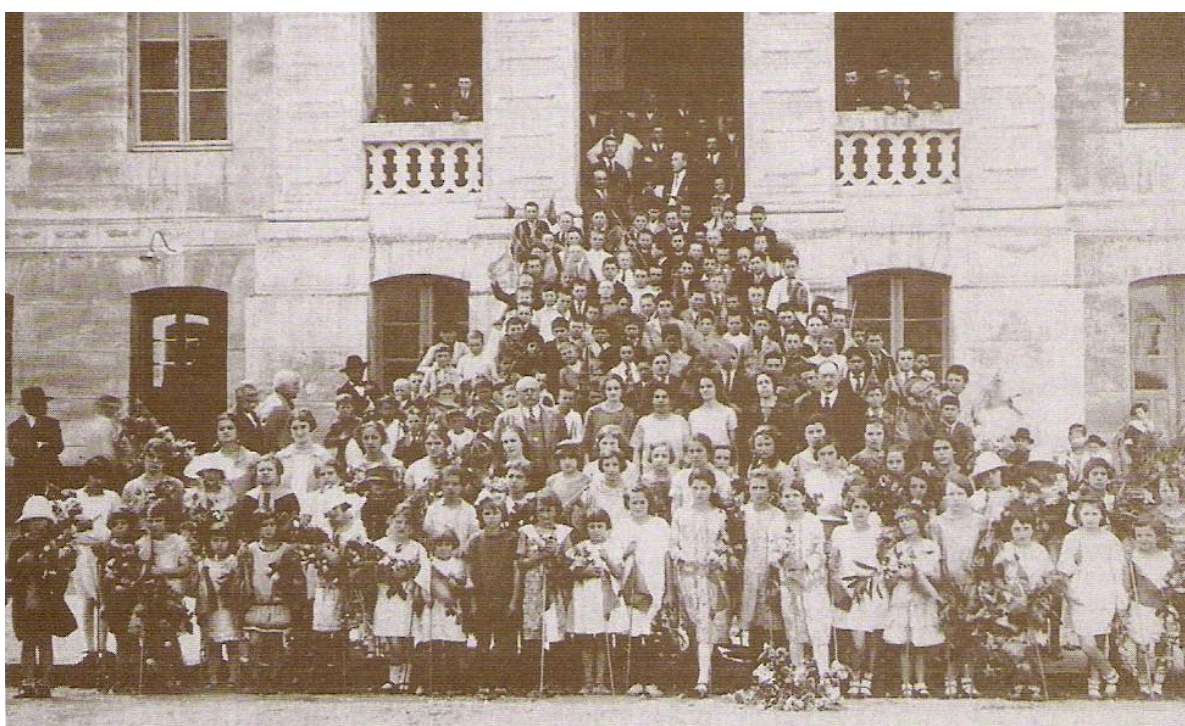
Figura 1 - Colégio Elementar de Bento Gonçalves na década de 1920. Ao fundo, o prédio da Intendência onde, no térreo, funcionou o Colégio até o ano de 1935.

No caso de Bento Gonçalves, o Colégio Elementar funcionou de 1910 até 1935 no andar térreo da própria sede administrativa da Intendência, conforme se pode observar na figura a seguir: