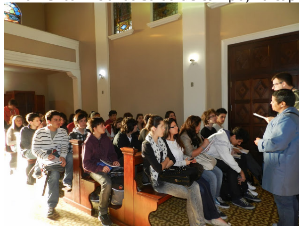
Figura 1 – Momento inicial da saída de campo, na capela do Cemitério.

Como atividades de pré-campo, foram realizadas duas aulas expositivas e dialogadas – uma no próprio espaço escolar e outra na capela do cemitério visitado. Nestes momentos, foram apresentados alguns elementos do que seria visualizado em campo, no cemitério e oferecendo algumas pistas para que os alunos conseguissem realizar as relações que buscávamos, entre o ordenamento de um cemitério e as diferentes áreas urbanas. Também foi solicitada uma atividade de produção textual com título “Como eu penso em relacionar Geografia a um cemitério? ”, para que exercitassem a habilidade da escrita, relacionando com o tema.