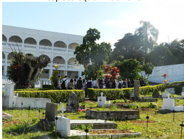
Figura 6 – Outra ala do cemitério – perda de valor econômico – relação com a especulação imobiliária