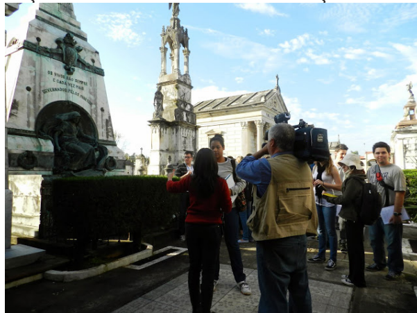
Figura 3 – Em frente ao túmulo de Júlio de Castilhos, cujo monumento possui relações com o monumento da Praça da Matriz.