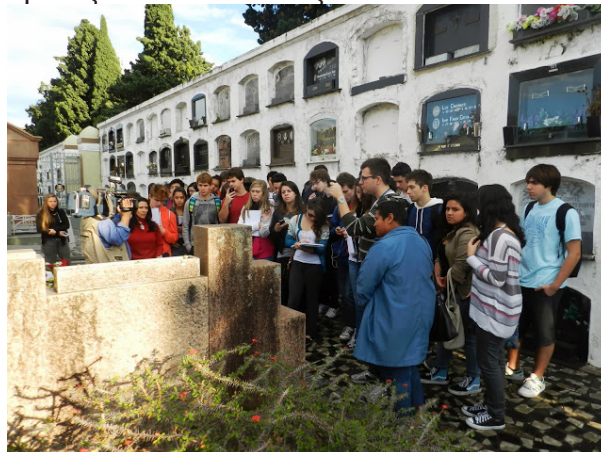
Figura 5 – Explicação sobre as relações entre o fenômeno da verticalização

no cemitério através da construção de “gavetas” (figura 5) ou do fenômeno da segregação socioespacial (figura 6).