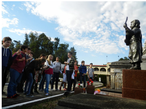
Figura 4 – Personalidades históricas – Vitor Mendes Teixeira (Teixeirinha)