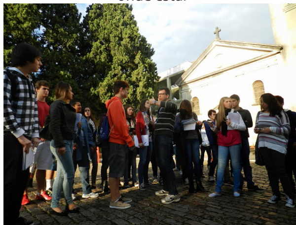
Figura 2 – explicação e visualização do alto da colina da Oscar Pereira – visualização do centro histórico de Porto Alegre e o porquê da localização do cemitério onde está.

cidade de Porto Alegre a partir da vista do que chamam “Colina da Saudade”, referindo-se ao pequeno morro existente no local. Destacou-se que o cemitério visitado está posicionado geograficamente em um local que, quando de sua construção (1850), era em um local afastado do que era a então Porto Alegre. O sítio urbano era afastado da cidade, pois não havia formas pontuais de controle dos dejetos da putrefação do corpo humano. Assim, construiu-se o cemitério afastado da cidade, para dar conta deste problema urbano. Explicou-se que, assim como o cemitério fora construído afastado do então núcleo urbano, outros equipamentos urbanos também foram edificadas longe da cidade, como alguns hospitais, dentre eles o “leprosário” de Porto Alegre.