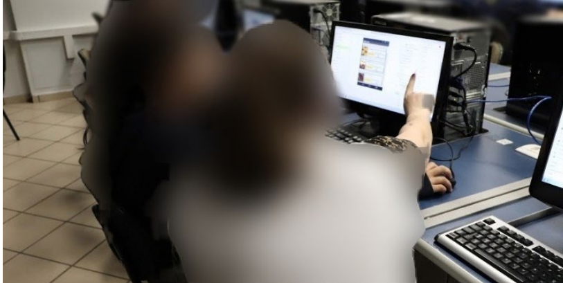
Figura 01 — Aulas de introdução às ferramentas

Cada capítulo era composto por cerca de 20 passos. A Figura 01 apresenta a aplicação prática da ferramenta com mediação do professor.