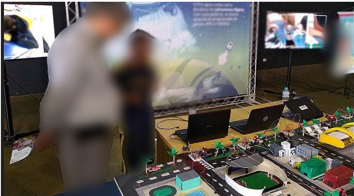
Figura 09 — Mostra do conhecimento (aluno apresentando a maquete construída)