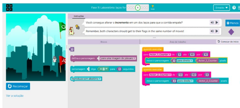
Figura 05 — Atividade de estrutura de Repetição, com o uso da plataforma code.org

Aula 02 – Sinalizador de Código Morse: apresentaram-se o código morse e os tipos de codificação de caracteres. Durante a aula, os alunos puderam mostrar soluções desenvolvidas em casa (desafio da aula anterior). Assim, o desenvolvimento do conhecimento ocorreu a partir de iniciativas e descobertas dos próprios alunos. Para tal, utilizou-se a plataforma code.org , conforme apresentado na Figura 05, para aprender e treinar estruturas de repetição e funções.