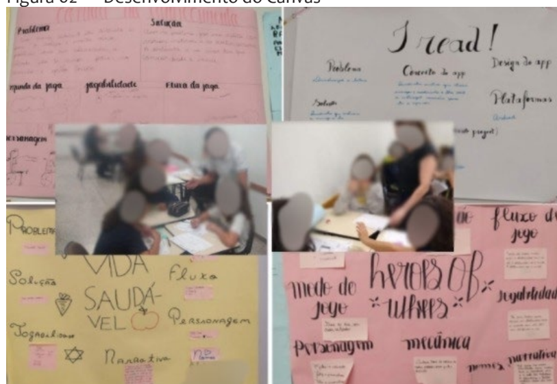
Figura 02 — Desenvolvimento do Canvas

Na segunda aula, os alunos trabalharam utilizando o Canvas, conforme apresentado pela Figura 02, idealizando e propondo soluções para o problema apresentado. Através dessa atividade, os alunos tiveram a oportunidade de desenvolver habilidades, tais como: interagir com os outros, teorizar e assumir identidades.