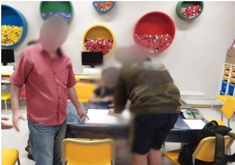
Figura 06 — Desenvolvimento e construção da maquete do eixo monumental

materiais utilizados, na sua maioria, eram recicláveis, tais como: caixas de leite, caixa de pasta de dente, garrafa pet, sulfite reutilizado, entre outros. Optar por esses materiais permitiu discussão sobre reaproveitamento. Em vez do descarte como lixo, foram reutilizados em outras situações, além da proposta original de uso.