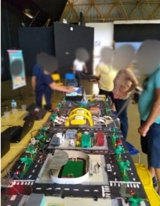
Figura 08 — Mostra do conhecimento, maquete final