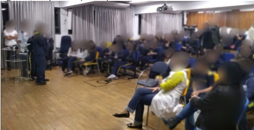
Figura 04 — Apresentação dos pitches

A partir da quarta aula, os alunos iniciaram o desenvolvimento dos produtos: 6º e 7º anos desenvolveram jogos; 8º e 9º anos, aplicativos. Totalizaram-se cerca de 30 horas/aula de desenvolvimento por turma. Ao final, ocorreu a exibição dos Pitches , conforme apresentado na Figura 04, em que cada turma teve a oportunidade de se apresentar para as turmas de séries anteriores (por exemplo, cada turma do 9º ano se apresentou para as turmas do 8º ano). Esta dinâmica permitiu que os alunos soubessem o que lhes esperava na série seguinte.