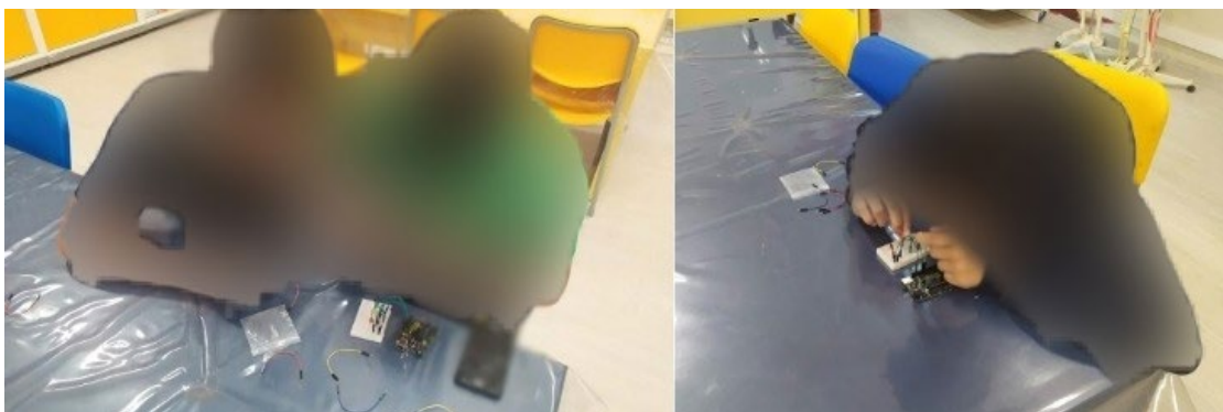
Figura 07 — Prática com Arduino

Além disso, durante o quarto bimestre, os alunos tiveram a oportunidade de colocar em prática o que aprenderam no terceiro bimestre, ou seja, os protoboards, o Arduino , as leds e os fios, além da lógica e da programação dos códigos de leds piscantes desenvolvidos por eles mesmos, conforme Figura 07.