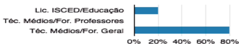
Gráfico 1. Gestores del municipio de Gambos