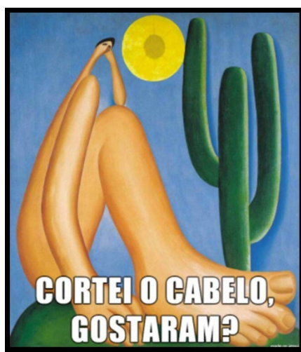
Figura 5: Meme do Abaporu

As diferentes camadas de mixagem produzidas pelo estudante nesse meme invertido demonstram o trabalho semiótico de manutenção não apenas de elementos como imagens e texto verbal, ocorrido nos memes das Figuras 2 e 3, mas também de manutenção de recursos de saliência e modalização das imagens. A busca pelo filtro que gera o efeito negativo de filme e a colagem da bandeira antirracista com os dizeres irônicos (invertidos, como dizem os estudantes) “Artista antirracista” salientam o agenciamento do estudante autor. Soma-se a esse trabalho de remixagem dele as etapas de design, tais como perceber a aptidão do meme invertido para veicular o novo discurso antirracista, utilizando justamente um autor denunciado por racismo.