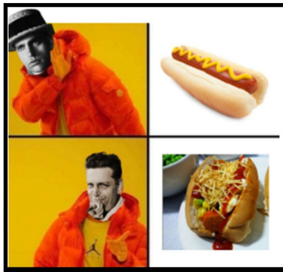
Figura 3: Meme do cachorro-quente

de ironia, e, por fim, essa oração realiza a integração entre os modos imagéticos e verbais do layout.