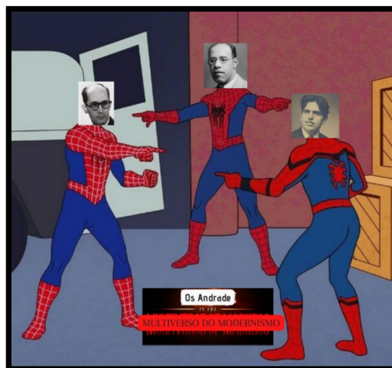
Figura 6: Meme do Homem-Aranha

A escolha pelo texto verbal “Cortei o cabelo, gostaram?”, acompanhada do quadro modernista, remete ao poema-piada, ao verso popular e ao cotidiano mais prosaico a que muitos artistas recorreram nas produções de 1ª fase do Modernismo brasileiro. A pergunta inicialmente inocente, superficialmente sem maiores relações com a literatura, sem relações intertextuais mais sofisticadas, sem críticas ou ironia, ou seja, sem todos os elementos presentes nos memes analisados até aqui, poderia gerar o seguinte questionamento: é mesmo um meme, tal-qualmente os modernistas foram questionados pelos críticos se os seus textos-piadas e em português “vulgar” eram poemas? Não seria senão um meme-piada (embora todo meme tenha algo de piada)? Este meme do estudante, despretensioso, busca pura e simplesmente a graça, tão necessária quanto a crítica e o posicionamento político.