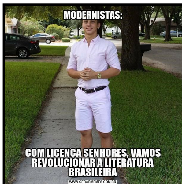
Figura 2: Meme do rapaz engomadinho

Passemos, então, à análise de alguns dos memes entregues pelos alunos. Optamos, aqui, por selecionar somente memes estáticos, devido ao formato em que este artigo circulará 2 .