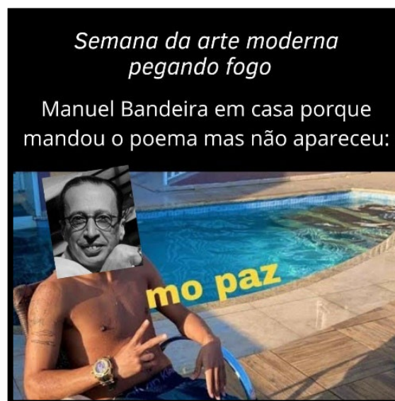
Figura 8: Meme do Mó Paz

A produção do estudante oferece camadas de ressignificação, em um processo de redesign da palavra casa, ao modo de Duchamp. Enfim, não fazemos mais o sentido, mas sim o ressignificamos, constantemente. E não precisa ser artista para fazê-lo.