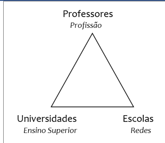
Figura 1: Triângulo da Formação

Para esse autor, “é na interação entre três vértices, neste triângulo, que se encontram as potencialidades transformadoras da formação docente” (NÓVOA, 2019, p. 7). Isso, obviamente, requer superar a visão dicotomizadora que supõe a academia como lugar de cultura, onde se adquirem conhecimentos teóricos em estreita vinculação com a pesquisa e o pensamento crítico, enquanto a escola é considerada apenas como ambiente em que realizarão as práticas – ações concretas que definem o ser professor.