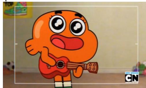
Figura 2: Darwin Raglan Caspian Ahab Poseidon Nicodemius Watterson III - em seu quarto

Darwin, como seu próprio nome indica, é um símbolo da teoria darwiniana, pois se sabe que a evolução é base da teoria da Seleção Natural de Charles Darwin. Todos os outros peixes dourados anteriores de Gumball morreram, pelo fato de não se adaptarem, mas Darwin, entretanto, se adaptou e mantém importância fundamental na narrativa.