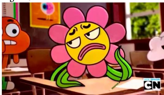
Figura 5: Leslie - sala de Aula da Srt a Símio

O que não se pode passar despercebido, neste caso, são os dois símbolos que Leslie traz, muito discutidos na atualidade: os gêneros sexuais. A primeira sendo a desconstrução do conceito de que ser homossexual é algo que se têm influências ao longo da vida, e que por Leslie ser uma planta, já nasce e cresce com essa condição; e a segunda é que Leslie seria um transgênero, um “menino” no corpo de uma “menina”.