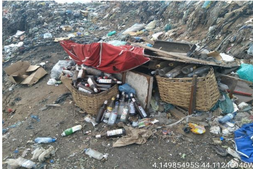
Figura 3: Garrafas de vidro de bebidas alcoólicas identificadas no lixão de Coroatá