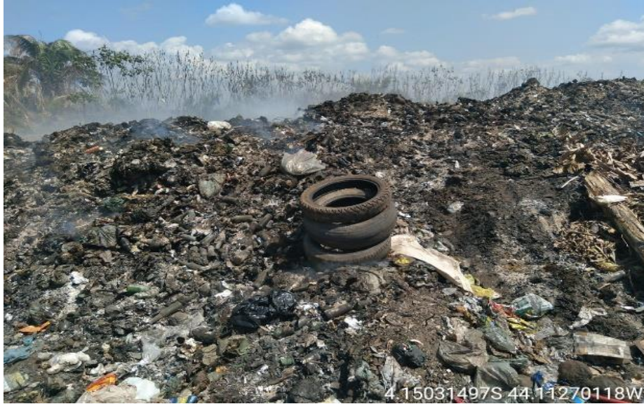
Figura 5: Pneus dispostos no lixão de Coroatá

útil seguindo, assim, a logística reversa prevista na Política Nacional de Resíduos Sólidos (Brasil, 2010), para que possam ter uma destinação correta. Isso também vale para os resíduos eletrônicos como carregadores, pilhas, baterias e outros que são considerados classe I.