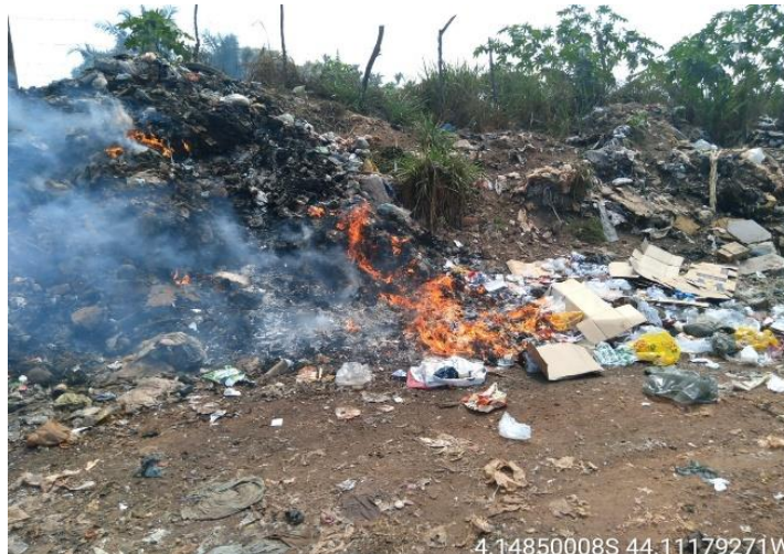
Figura 7: Resíduos sólidos sendo queimados no lixão de Coroatá

Foi constatado que na área do lixão de Coroatá ocorre a queima dos resíduos (Figura 7) e isso, segundo o autor Correia (2020), impacta na saúde das pessoas que trabalham no lixão e das que moram próximas ao local, além disso, contribui para emissão de gases de efeito estufa. Não foram realizadas entrevistas com os catadores e nem com as pessoas que residem próximas, mas sabe-se, conforme Correia (2020), que a fumaça pode gerar e agravar problemas respiratórios como asma, entre outras.