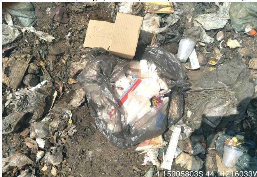
Figura 4: Resíduos de saúde (seringas) em saco preto dispostos de modo inadequado no lixão