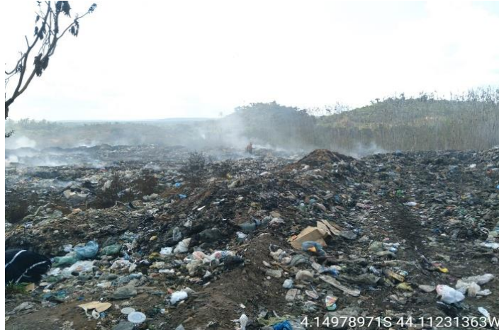
Figura 6: Área do lixão sem cobertura vegetal e com características físicas alteradas

que a degradação do solo pode ocorrer também pela movimentação de veículos utilizados para coleta dos resíduos de limpeza urbana, caçambas que, ao entrarem em contato com o solo do lixão, causam compactação do solo e, conseqüentemente, a redução dos micros e macroporos, reduzindo a capacidade de infiltração do solo, dificultando o desenvolvimento do sistema radicular das plantas e conseqüentemente dificultando a absorção dos nutrientes.