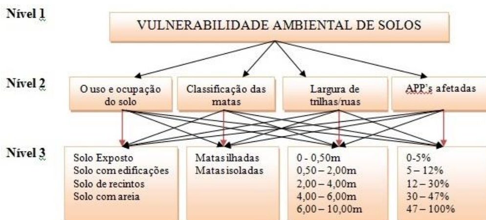
Tabela 1: Hierarquia da técnica do Método de Análise Hierárquica.

Para a aplicação da técnica AHP escolhida, especifica-se três etapas de estudo. Na primeira etapa projeta-se a estrutura do modelo, que será dividido em 3 níveis: Para o Nível 1, foi priorizado o objetivo da análise hierárquica que neste trabalho será a análise da vulnerabilidade ambiental de solos; - no Nível 2, destacam-se os fatores de medição de valor que determinam o nível de vulnerabilidade ambiental do Parque, como: o uso e ocupação do solo; a classificação das matas em - matas isoladas e matas ilhadas - ; a largura de trilhas/ruas e as Áreas de Preservação Permanente (APP) afetadas. E por fim o Nível 3 detalha os itens do nível anterior de acordo com as classes existentes (Tabela 1).