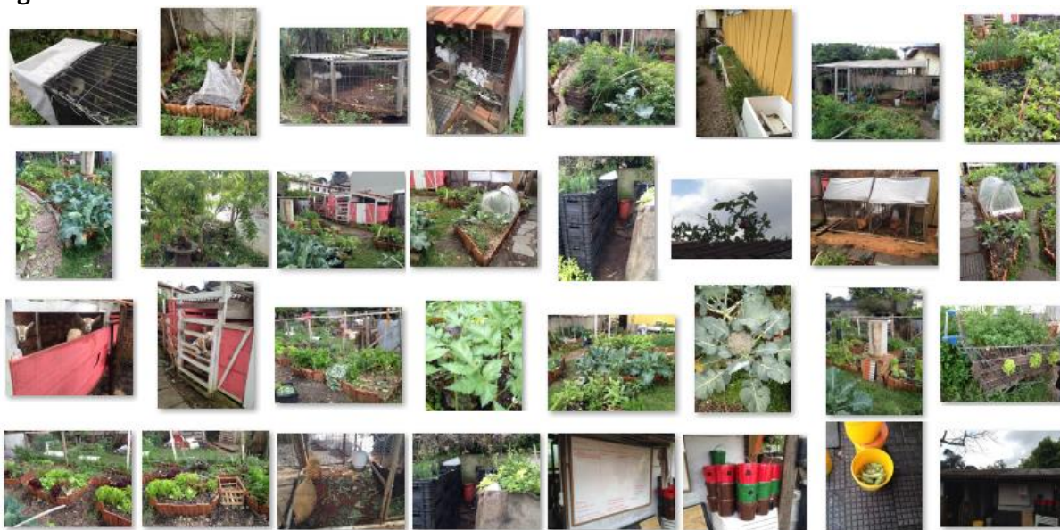
Figura 1 – Fotos da unidade-caso