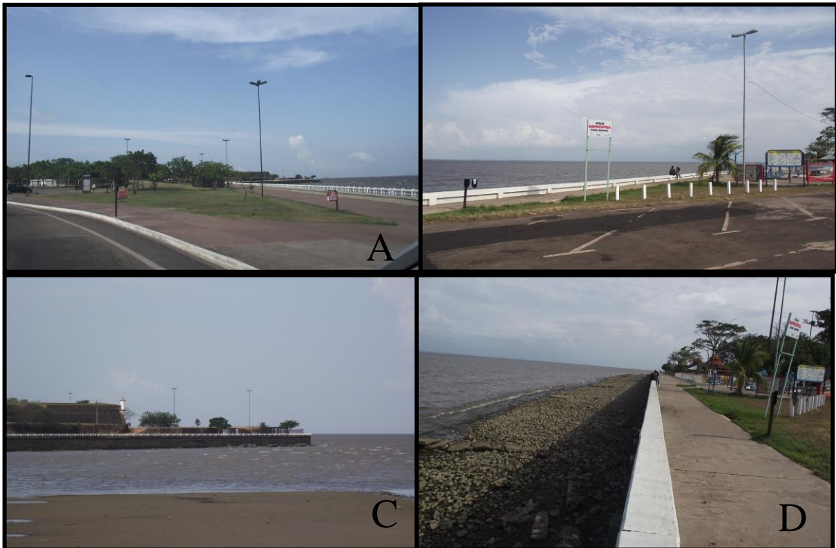
Figura 3: (A) Parque en torno de la Fortaleza de São José de Macapá y la orilla del Río Amazonas; (B) Área de Ocio con academia al aire libre al borde del mar; (C) Río Amazonas y al fondo la Fortaleza de São José de Macapá; y (D) Orilla de Macapá.

La costa de la ciudad de Macapá tiene una extensión de unos 15 Km y las coordenadas 00^{\circ} 09' 17,55'' N y 51^{\circ} 00' 39,34'' O , es bañado por el Río Amazonas. Está a 17 metros sobre el nivel del mar y tiene una zona urbana de 6.407 km 2 .