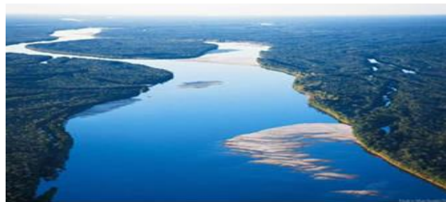
Figura 2: Río Amazonas

Según el estudio "Metodología de Medición de las Extensiones de los Ríos Amazonas y Nilo con las imágenes Modis y Geocover", organizada por el Instituto Nacional de Investigaciones Espaciales (INPE) en el año 2008, el Amazonas es el río más grande del mundo. De acuerdo con la metodología del trabajo coordinado por Paulo Roberto Martini, de la División de la Tele observación del INPE, el Amazonas tiene 6.992,06 kilómetros de extensión, mientras que el Nilo alcanza 6.852,15 kilómetros. La naciente del Río Amazonas está ubicada en la cordillera de Los Andes, Perú.