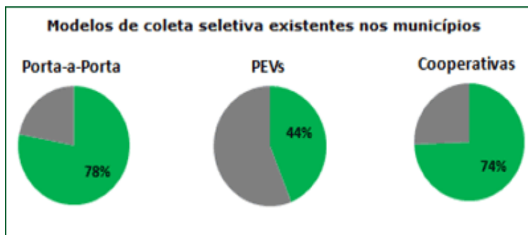
Gráfico 2 – Modelos de coleta seletiva existentes nos municípios.