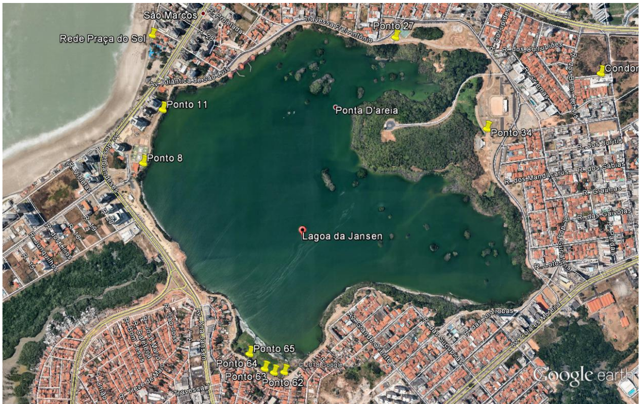
Figura 4: Pontos com maior frequência de lançamento na Laguna da Jansen (2019).