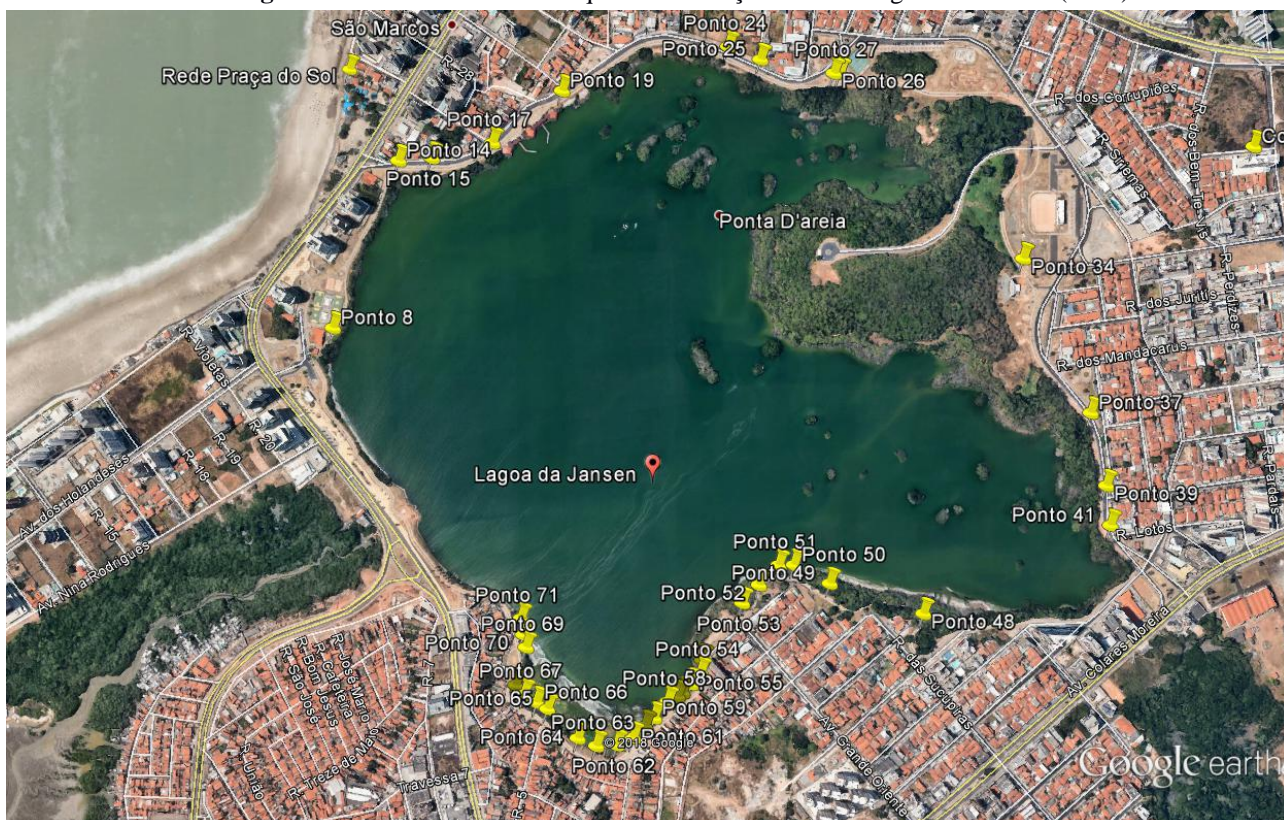
Figura 2: Pontos com maior frequência de lançamento na Laguna da Jansen (2017).