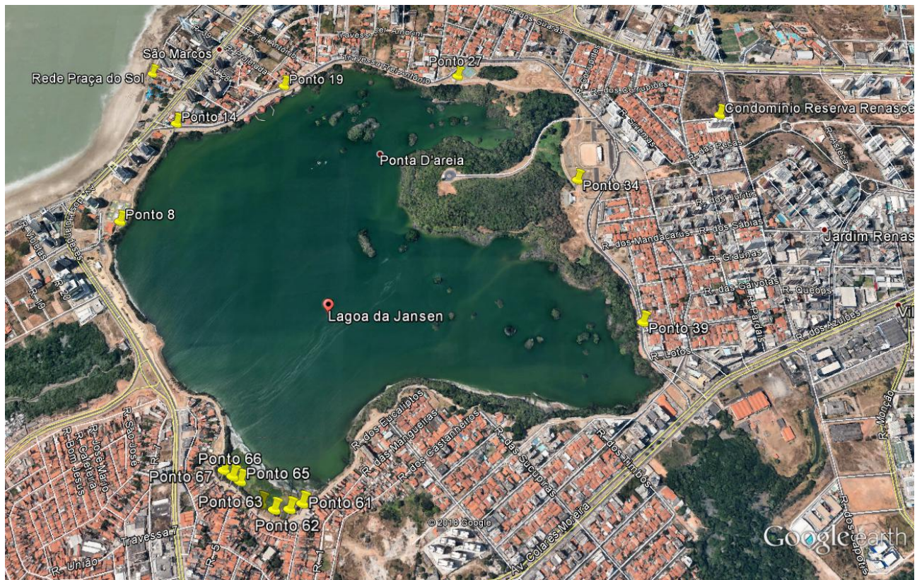
Figura 3: Pontos com maior frequência de lançamento na Laguna da Jansen (2018).